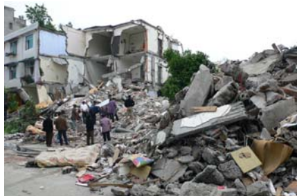
都江堰市倒塌的房屋

家在都江堰的马丁用颤抖的手拨打家里和亲属的电话,不通!组里的同志往成都打,都不通!包信和老师得知后,马上与成都的一个朋友联系,对方回复了一条短信:成都有强烈震感,何况都江堰!人们心急如焚,马丁一夜未眠,组里的部分师