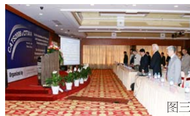
图一:我所下半旗志哀;图二:所班子全体成员、部分院士、研究室主任和相关部门的管理人员、研究室的科技人员等默哀;图三:参加中日双边量热学和热分析学术会议的中外专家学者默哀;图四:催化基础国家重点实验室全体科技人员和研究生默哀;